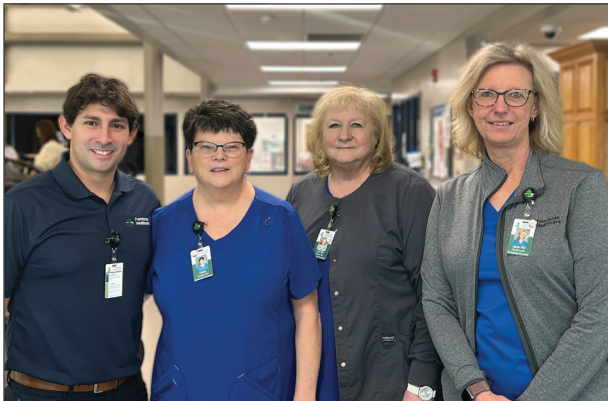
Miembros del equipo de rehabilitación cardíaca de Franciscan Healthcare, 2025

La rehabilitación cardíaca está cubierta por Medicare y la mayoría de los seguros privados.